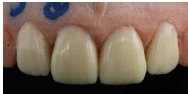
Figura 7 - Enceramento diagnóstico, criando uma nova anatomia e harmonia dental.

realizado um molde com silicone transparente (Elite Transparente – Zerhmack – Fig. 8). Com isso, torna-se viável a aplicação de resina composta direta dentro desse molde para levar em posição em boca e fotopolimerizar (Fig. 9). A Figura 10 mostra os provisórios de resina composta após os procedimentos de acabamento e polimento. Note que a anatomia seguiu o padrão do enceramento diagnóstico.