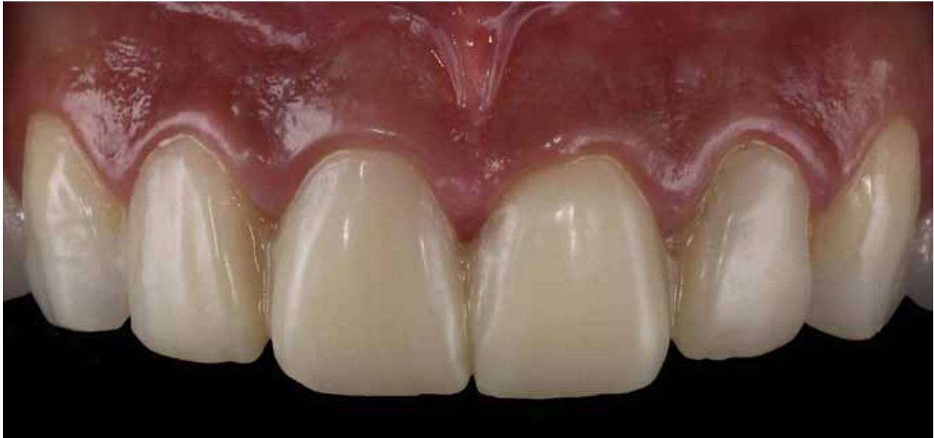
Figura 10 - Provisórios de facetas feitos com resina composta a partir do molde do enceramento com silicone transparente. Observe a semelhança com a anatomia do enceramento diagnóstico.