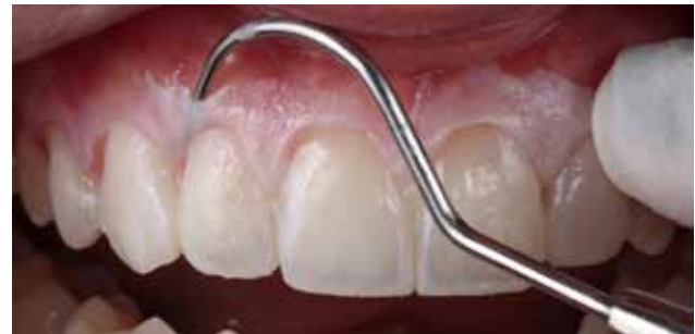
Figura 4 - Aspecto imediato após remoção do molde de silicone para remoção dos excessos de resina.