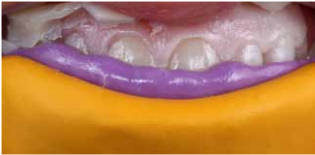
Figura 3 - Mock-up realizado a partir do enceramento com resina bis-acrílica (Protemp 4 – 3M Espe), simulando o provável resultado final do tratamento.