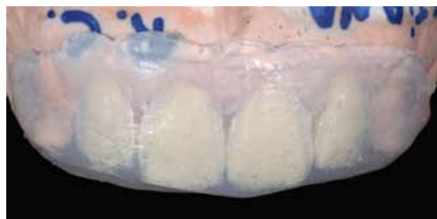
Figura 8 - Moldagem do modelo encerado com silicone transparente (Elite transparente – Zerhmack).

realizado um molde com silicone transparente (Elite Transparente – Zerhmack – Fig. 8). Com isso, torna-se viável a aplicação de resina composta direta dentro desse molde para levar em posição em boca e fotopolimerizar (Fig. 9). A Figura 10 mostra os provisórios de resina composta após os procedimentos de acabamento e polimento. Note que a anatomia seguiu o padrão do enceramento diagnóstico.