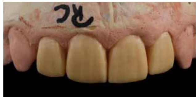
Figura 12 - Enceramento diagnóstico personalizado.

remoção das restaurações e acesso ao canal dos laterais (coroas). Aspecto após os preparos finalizados e os laterais com pinos de fibra de vidro personalizados cimentados (Fig. 14). A Figura 15 mostra o aspecto final das restaurações cerâmicas metal-free (E.max press – Ivoclar Vivadent). Facetas 11 e 21; coroas 12 e 22. A semelhança com o enceramento (Fig. 12) mostra a previsibilidade do resultado estético final.