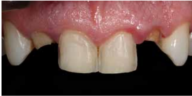
Figura 13 - Preparo dos centrais (faceta) e remoção das restaurações e acesso ao canal dos laterais (coroas).