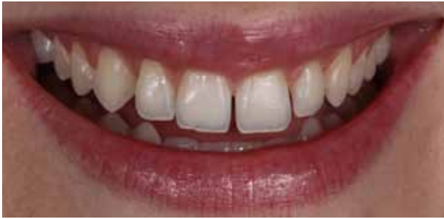
Figura 1 - Situação inicial de diastemas e deficiência de forma de alguns dentes.

235 236 237 238 239 240 241 242 243 244 245 246 247 248 249 250 251 252 253 254 255 256 257 258 259 260 261 262 263 264 265 266 267 268 269 270 271 272 273