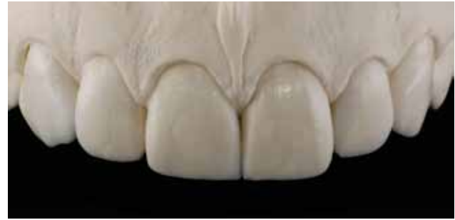
Figura 2 - Enceramento diagnóstico, facilitando o planejamento para execução de possíveis lentes de contato e fragmentos cerâmicos.