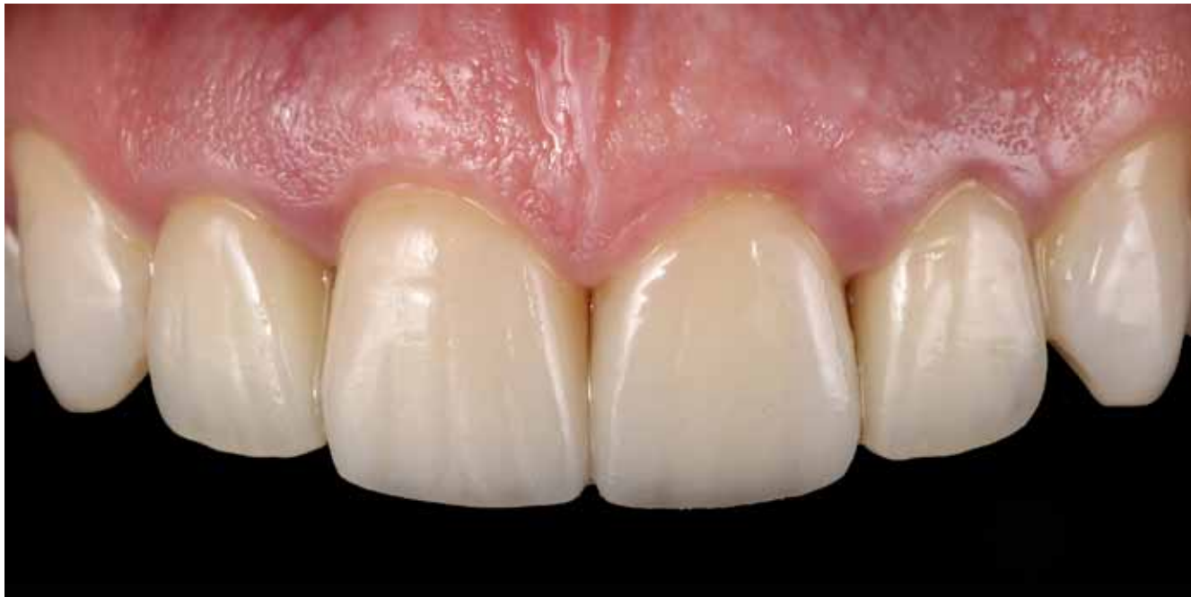
Figura 15 - Aspecto final das restaurações cerâmicas metal-free (E.max press – Ivoclar Vivadent). Foram realizados facetas no 11 e 21, e coroas no 12 e 22. A semelhança com o enceramento mostra a previsibilidade do resultado estético final.