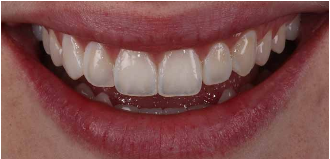
Figura 5 - Resultado estético desejado sendo simulado na boca do paciente (mock-up), o qual foi seguido a partir do enceramento diagnóstico.

274 275 276 277 278 279 280 281 282 283 284 285 286 287 288 289 290 291 292 293 294 295 296 297 298 299 300 301 302 303 304 305 306 307 308 309 310 311 312