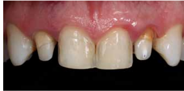
Figura 14 - Aspecto após os preparos finalizados e os laterais com pinos de fibra de vidro personalizados cimentados.